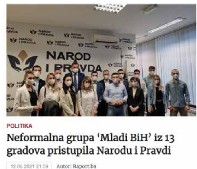
Preuzeto sa portala Raport.ba 16.06.2021. godine