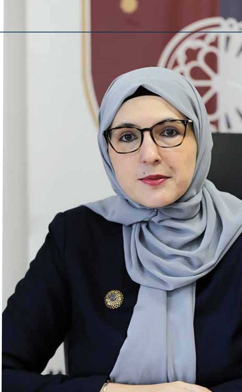
Počeo da radi Institut za razvoj preduniverzitetskog obrazovanja KS