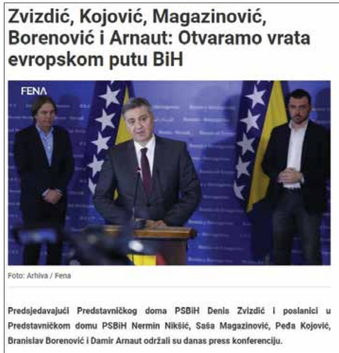
10.03.2022. godine