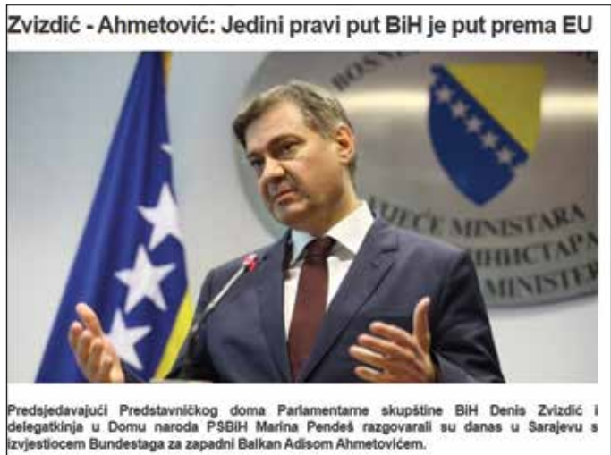
Članak sa portala Source.ba 04.0.2022. godine