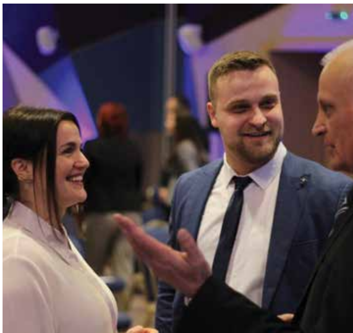
Politička akademija Naroda i Pravde - dodjela certifikata Generaciji 20/21