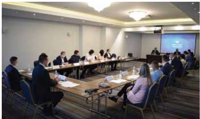
Prva sjednica Povjereništva mladih Naroda i Pravde BiH