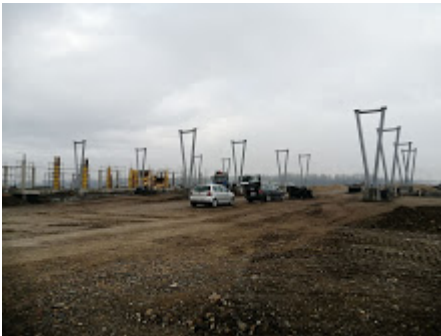
GP Svilaj.jpeg 358K